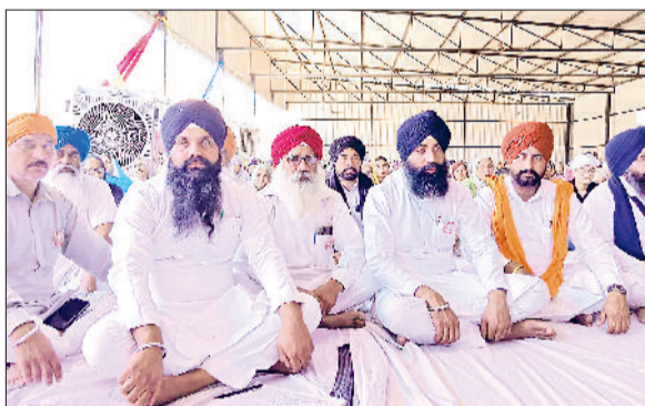
शहजादपुर। धार्मिक कार्यक्रम में मौजूद सिख संगत।