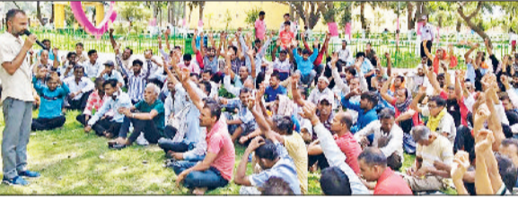
पानीपत। पानीपत के हाली पार्क में प्रदर्शन करते स्पीनिंग उद्योग के श्रमिक।

जब तक भूखा इंसान रहेगा धरती पर तूफान रहेगा इस नारे के साथ सेंटर ऑफ इंडियन ट्रेड यूनियन मजदूर संगठन से संबंधित इंडस्ट्रियल वर्कर यूनियन के नेतृत्व में हाली पार्क के अंदर स्पीनिंग उद्योग के मजदूर की सभा की शुरुआत की गई। इसके अलावा शिव वर्मा स्मारक भवन गीता कॉलोनी में सीटू जिला की बैठक आयोजित कर पानीपत में मजदूर