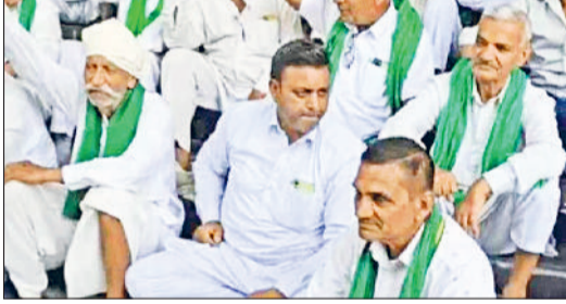
करनाल। नई अनाज मंडी में गेट बंद कर धरने पर बैठे किसान।

हरियाणा की मंडियों में लागू किए गए बायोमेट्रिक सत्यापन और नए नियमों के विरोध में सोमवार को किसानों ने करनाल की नई अनाज मंडी में जोरदार प्रदर्शन किया। किसानों ने मार्केट कमेटी कार्यालय के गेट बंद कर धरना दिया और सरकार के खिलाफ नारेबाजी की। सुबह करीब 11 बजे शुरू हुआ यह धरना दोपहर 2 बजे तक जारी रहा। इस दौरान किसानों ने कहा कि नए नियमों के कारण उन्हें अपनी फसल बेचने में भारी दिक्कतों का सामना करना पड़ रहा है। उन्होंने मांग की कि पहले की तरह सरल व्यवस्था लागू की जाए, ताकि किसानों को