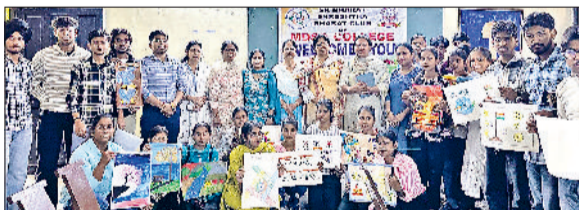
अंबाला। प्रतियोगिता में हिस्सा लेने वाले छात्र।