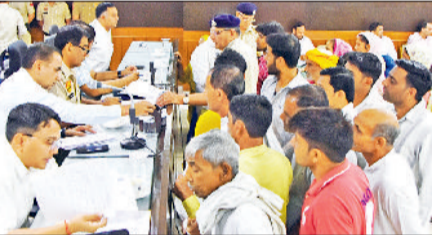
पानीपत। जनता समाधान शिविर में जनसुनवाई करते हुए डीसी व एसपी आदि अधिकारी।