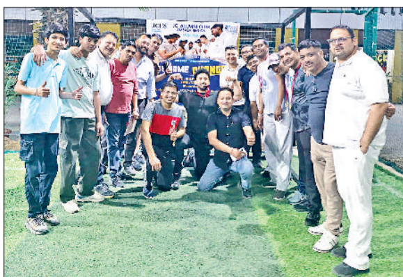
ट्रॉफी के साथ विजेता टीम व अन्य खिलाड़ी।

जेएसी अंबाला द्वारा अपने सदस्यों के लिए "दि गेम चेंजर क्रिकेट टूर्नामेंट का आयोजन सेंसिल कोंवेंट स्कूल के मैदान में किया गया। इस रोमांचक टूर्नामेंट में जेएसी अंबाला के सदस्यों की 4 टीमों ने भाग लिया और शानदार खेल भावना का प्रदर्शन किया। टूर्नामेंट का फाइनल मुकाबला स्पेशल सुप्रीमो और