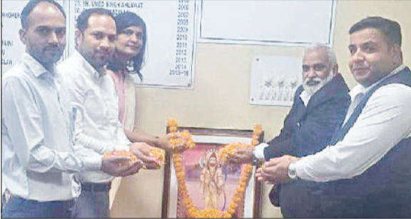
पानीपत। बार एसोसिएशन के ऑफिस में प्रभु परशुराम को नमन करते अधिवक्ता।