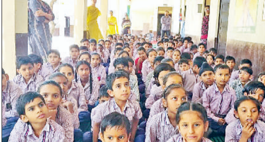
स्कूल परिसर में जागरूकता सत्र आयोजित किया गया। इसमें बच्चों