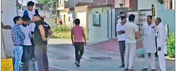
कुरुक्षेत्र। घर के बाहर खड़े परिजन व कॉलोनीवासी।

एक खुशहाल दिखने वाले परिवार को गले लगा लिया। जहां कभी घर में मासूम बच्ची सारा दिन खिल-